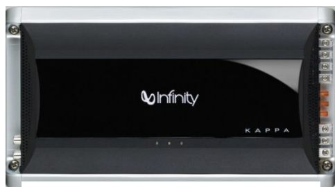
モノラル・サブウーファー用アンプ